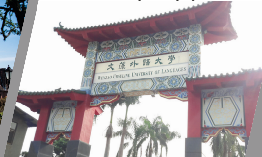
Wenzao Ursuline College of Languages, Taiwan