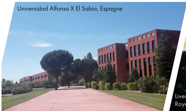
Universidad Alfonso X El Sabio, Espagne