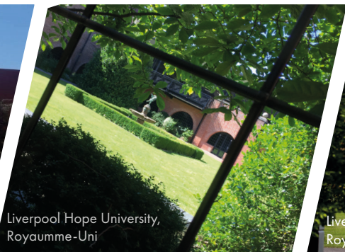
Liverpool Hope University, Royaumme-Uni